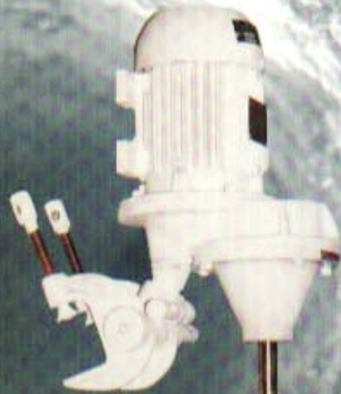
Agitador modelo B